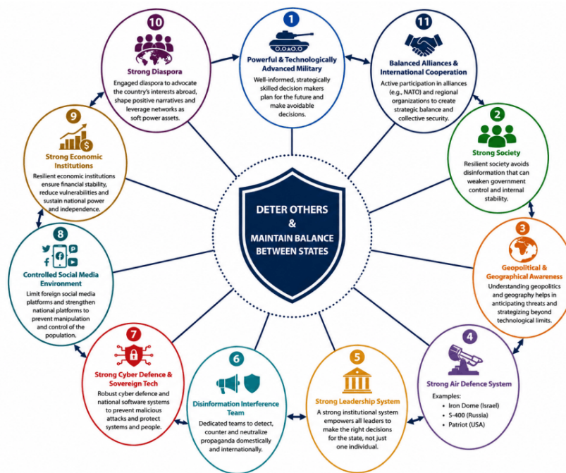
Figure 1: Key Elements for State Deterrence and Strategic Balance.

Deterrence also consists of many elements, including technologies and ideologies. For example, it encompasses long-term defence strategies, methods of preventing ballistic attacks, and technological advancements designed to overcome air defence systems (Osinga, 2020). Furthermore, the digitalized world has become increasingly vulnerable because information is a critical resource that enables detailed analysis of adversaries. As a result, cyber strategy has become vital to deterrence strategies. Therefore, deterrence should be defined as illustrated in Figure X below.